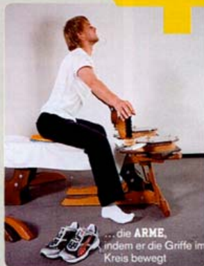
... die ARME , indem er die Griffe im Kreis bewegt